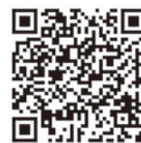
ふじさわ宿交流館 ホームページ